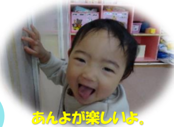
あんよが楽しいよ。

かわいい笑顔に囲まれて、 新年がスタートしました。 本年もよろしくお願ひいたします。 ひとひの「楽しい」「だいすき」を 見つけ、思い切り遊びたいと思います