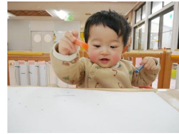
「うんうん」と色が付くことを嬉し そうに保育者に伝えていました。