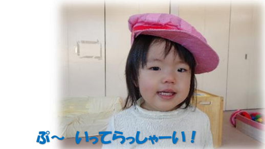
ぴ~ いらっしゃーい!