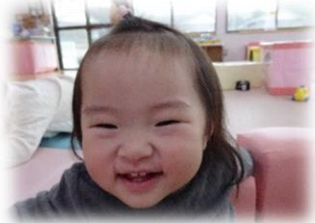
おままごとしよう!