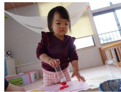
つぎは青色が いいな~