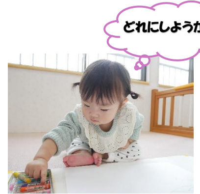
どれにしようかなあ~