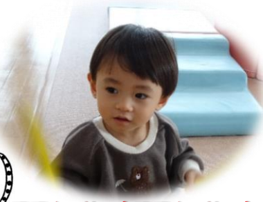
ででん、せい! ででん、せい!