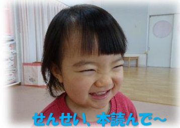
せんせい、本読んで~