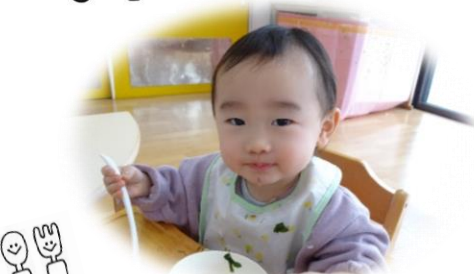
まんま美味しいよ~