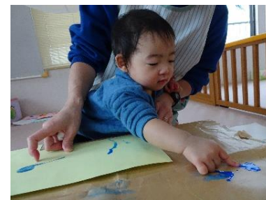
指で直接触って、絵の具の感触を 楽しんでいました。

ぽとんと落としの箱には、絵の具とたんぽを使ってスタンプ遊びをしました。最初は「何これ?」と不思議そうに見ていたのですが、保育者の真似をしてやってみるとポンポンと手が止まらない子どもたち。絵の具の丸い模様がどんどん増えていきます。同じ色を重ねたり、くっつかないようにしたりなど思い思いにスタンプを楽しみました。