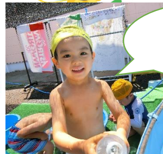
せんせい かけちゃうよ～