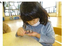
もみ殻をとり除き 拡大鏡で胚芽を 探す。